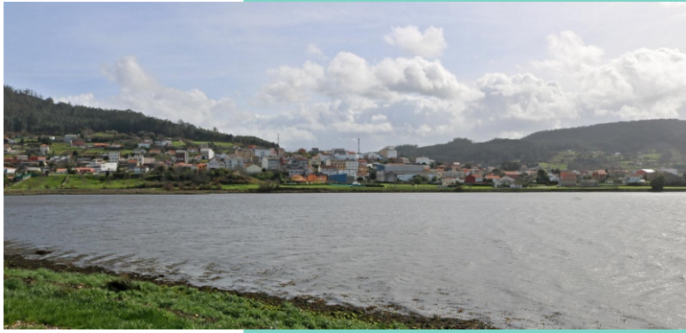
4-Ribeira do Coto