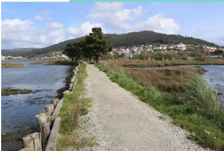
Un dos brazos da desembocadura do Río Beelle.