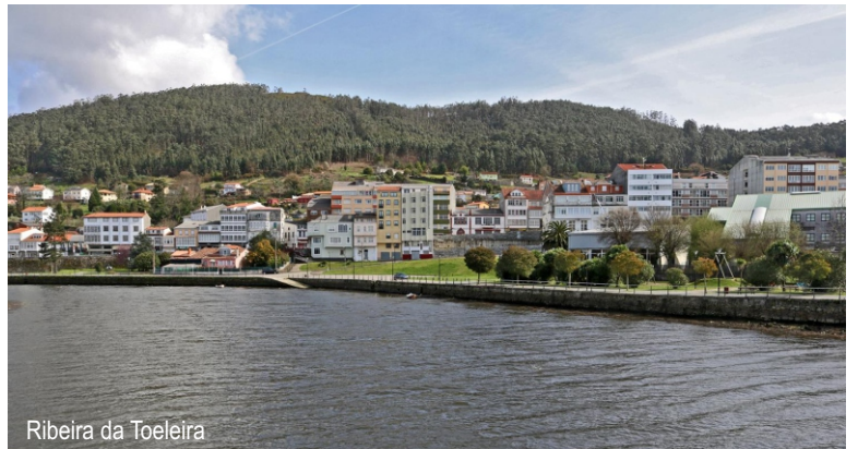
Ribeira da Toeira