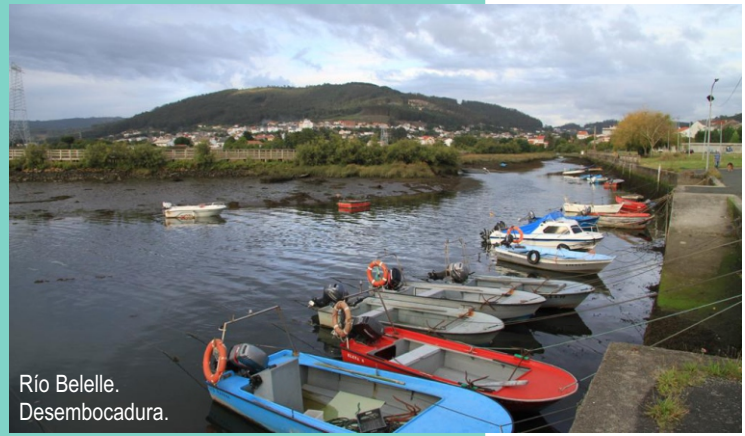
Río Beelle. Desembocadura.