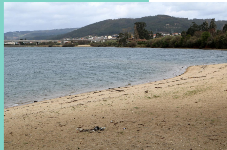
Praia do Puntal de Abaixo. Ao fondo opazo da Mercé.