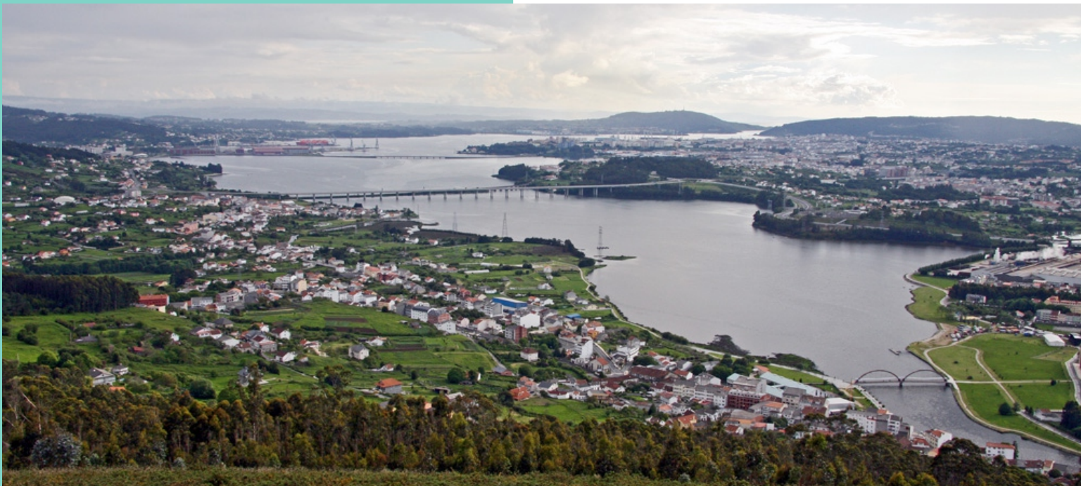
Vista da Ría de Ferrol desde o monte Ancos. Neda á esquerda da desembocadura do río Grande de Xuvia