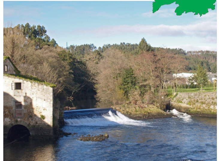
1-RÍO GRANDE DE XUVIA. Nace nos montes de Serra en terras das Somozas e, despois de 31 km, desemboca na Ría do Ferrol, entre Narón (Xuvia) e Neda.