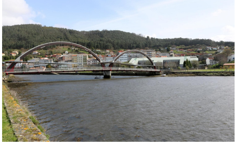
Ponte peonil do paseo marítimo Neda-Narón