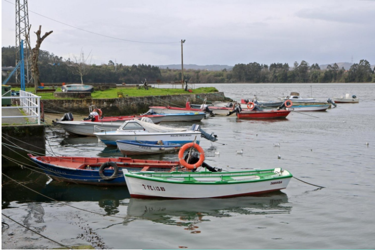
Porto de Neda

Nace no Forgoselo e desauga na ría de Ferrol, en Neda. Foi un río cun gran aproveitamento para mover mecanismos en muiños, fábricas de papel, e téxtiles, e nel instalouse unha das primeiras centrais hidroeléctricas. Hoxe move dúas minicentrais.