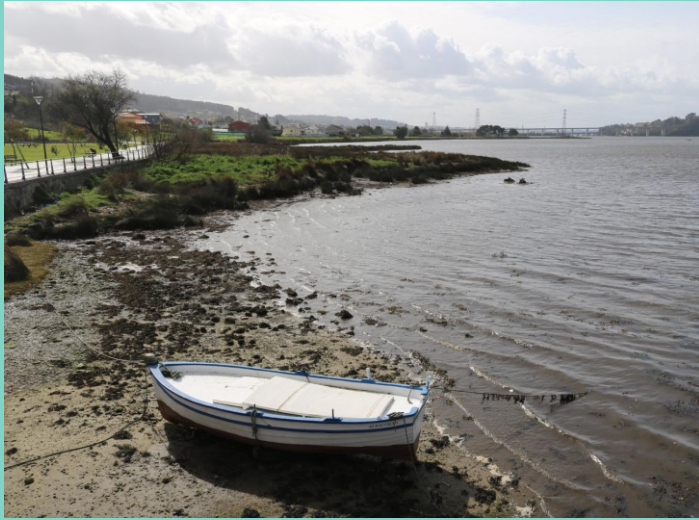
3- O Empedrón