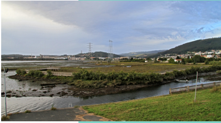
Ribeira de Santa María