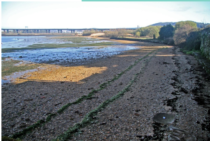
Ribeira da Mercedes